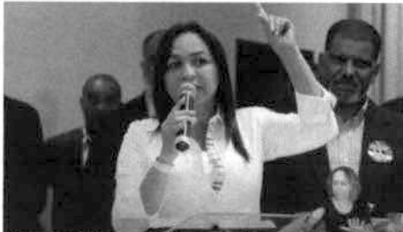
A senadora Eliziane Gama diz que o assédio sexual no serviço público é um atentado contra a dignidade da pessoa humana

Enquadrar o assédio sexual no serviço público como ato de improbidade administrativa. Este é o objetivo do Projeto de Lei 2763/2022, protocolada nesta quinta-feira (10), pela senadora Eliziane Gama (Cidadania-MA), na Secretaria da Mesa do Senado. O assédio, segundo autora da proposta, "é um atentado contra a dignidade da pessoa humana, atingindo a liberdade sexual da vítima, gerando consequências danosas, muitas vezes irreversíveis, e que por isso deve ser socialmente combatido. E a resposta do Estado deve ser ainda mais contundente quando a violência ocorre em um ambiente público", enfatizou.